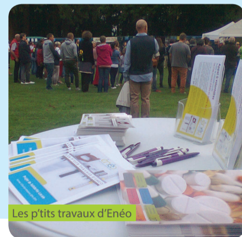
Les p'tits travaux d'Enéo

Une initiative d' Enéo (Ourthe-Ambève/région de Liège), mouvement social des Aînés (partenaire de la Mutualité chrétienne ).