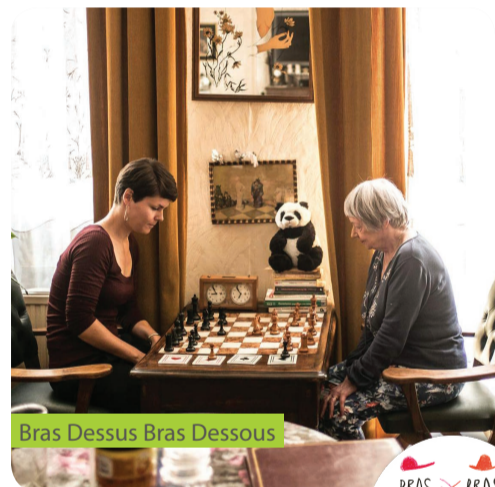
Bras Dessus Bras Dessous

Qui sont ces 9 projets? Comment évoluent-ils? Quels enseignements peut-on en retirer? C'est ce que cette mosaïque vous raconte, avec, çà et là, des témoignages de participants, des astuces de porteurs de projets, des chiffres, anecdotes et photos; le tout émaillé de vécus et de fous rires. ■