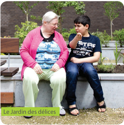
Le Jardin des délices