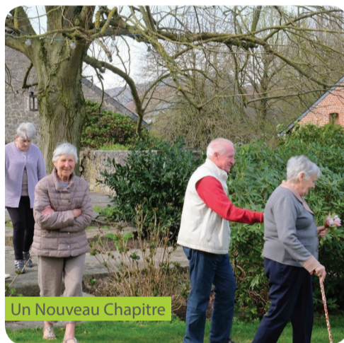
Un Nouveau Chapitre

« Quel bonheur d'avoir été sélectionnés par ce jury d'experts! Cette reconnaissance, nous l'avons accueillie comme la preuve que nous n'étions pas qu'une poignée de rêveurs, comme le signal annonçant que le moment était bel et bien venu pour ce genre d'innovation dans le paysage belge... »