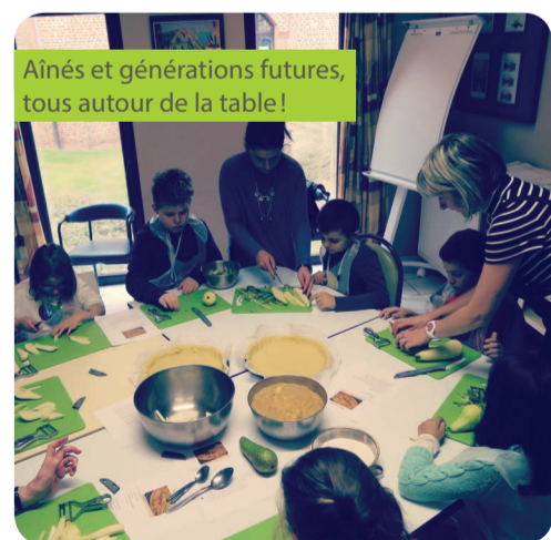
Aînés et générations futures, tous autour de la table!

« Etre lauréat nous permet de concrétiser un projet qui nous tenait à cœur et qui répondait aux envies de nos résidents. De plus, il nous permet de décrocher et d'ouvrir nos portes vers l'extérieur. »