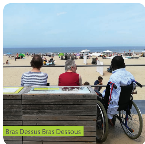
Bras Dessus Bras Dessous

30 demandes spécifiques d'aides administratives ou logistiques, directement traitées et/ou réorientées vers un partenaire.